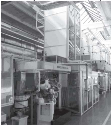
Automatická linka pre výrobu hliníkových túb Mall + Herlan,